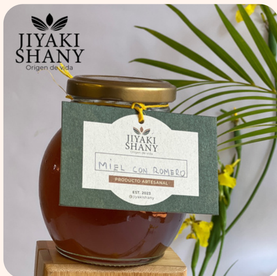
Miel con AE de romero