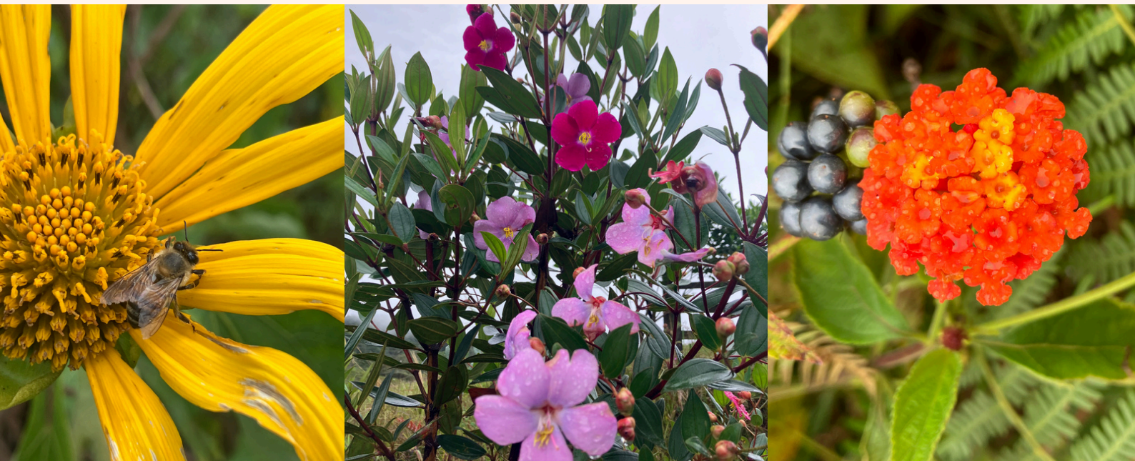
Fotos de algunas de nuestras flores

En algunas preparaciones, agregamos aceites esenciales para brindar un aroma o un sabor distinto, o para fines funcionales. Un ejemplo de ello es nuestra miel con aceites esenciales de menta y eucalipto, ideal para apoyar el bienestar respiratorio y aportar una sensación refrescante.