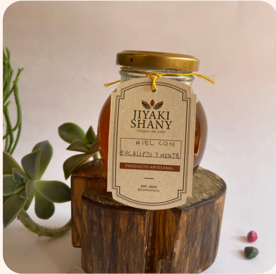
Miel con AE de menta y eucalipto