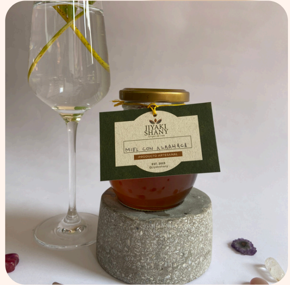
Miel con AE de albahaca